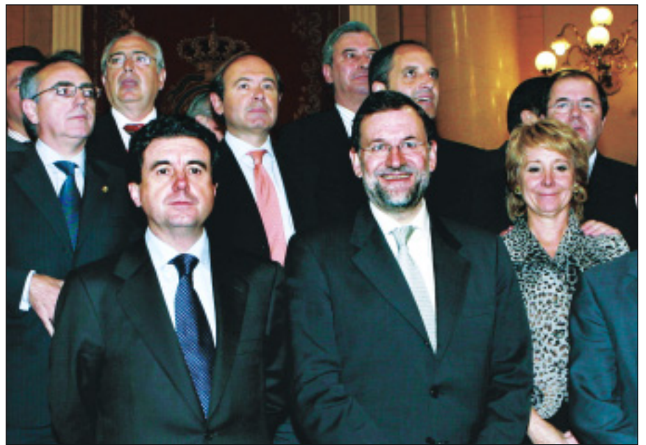
Rajoy, con los presidentes autonómicos del PP