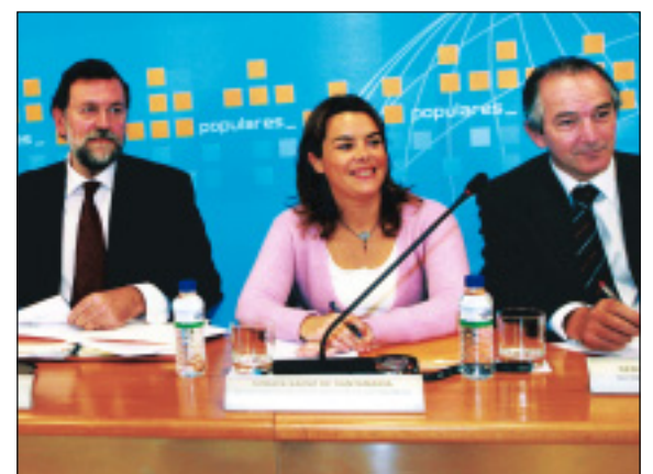
Reunión del Comité Ejecutivo Nacional