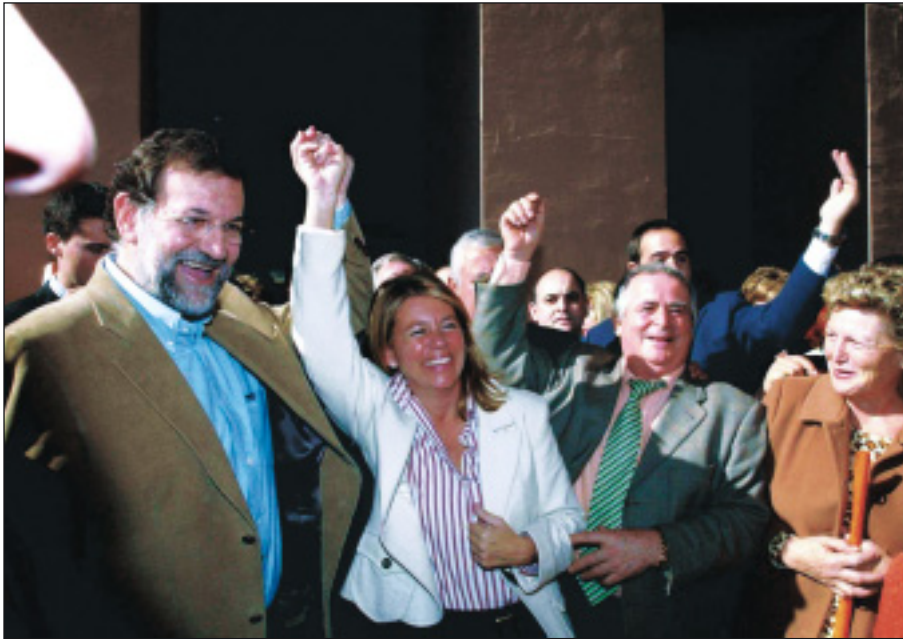
El presidente del PP, en un acto en Marbella