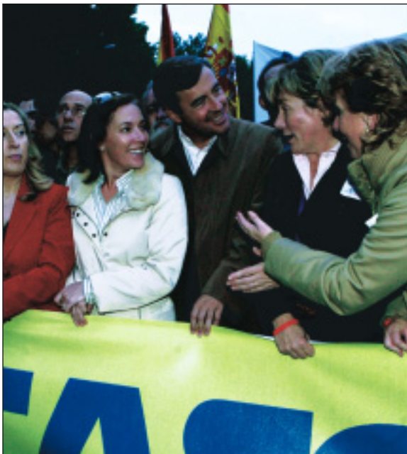
En la manifestación en contra de la LOE