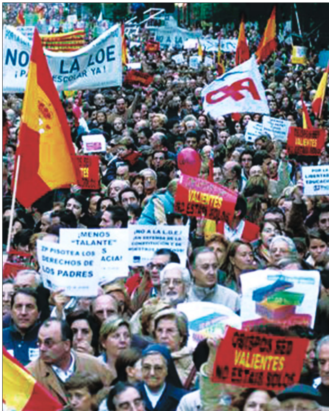
Los ciudadanos empiezan a manifestarse contra las políticas de Zapatero

Para La Vanguardia, la reforma territorial está pasando una costosa factura electoral a José Luis Rodríguez Za-