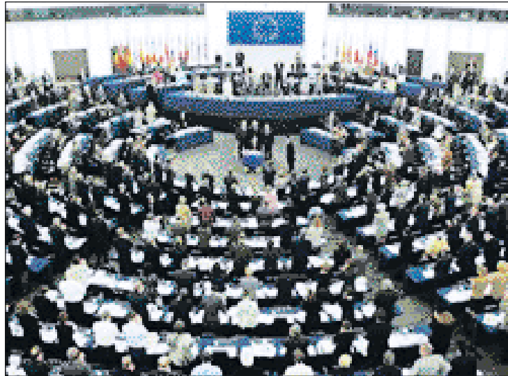
Pleno del Parlamento Europeo

Lo contaré antes de que lo hagan otros medios de comunicación: anoche, nueve periodistas españoles -diría que todos de primera fila si no fuera porque mi nombre está en la lista- cursamos una petición al Parlamento Europeo instándole a que desactive la operación política que ha puesto en marcha la Generalitat, con la complicidad de una parte del Gobierno, para arrebatarle definitivamente a la Cope sus emisoras en Cataluña. Como dice textualmente el documento dirigido anoche a la comisión de peticiones, "si no lo evitamos a tiempo, miles de ciudadanos catalanes perderán su derecho a escuchar los programas radiofónicos que libremente han sintonizado durante años". El tripartito catalán, como antes Pujol y después el que venga si no se hace nada para evitarlo, tienen la estúpida idea de que se pueden arrojar los derechos fundamentales protegidos por la ley sin que nadie se atreva a decir esta boca es mía. Pe-