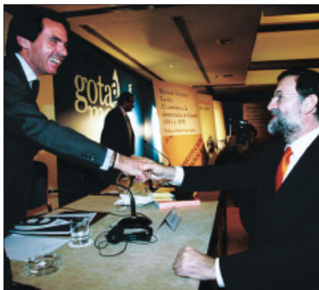
Aznar y Rajoy, en la presentación de la Editorial Gota a Gota