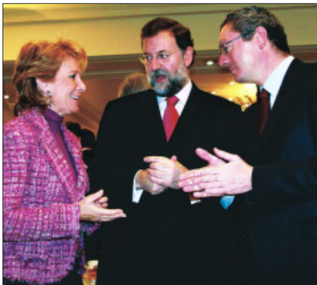
Esperanza Aguirre, Mariano Rajoy y Alberto Ruiz-Gallardón