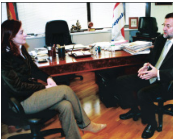
Reunión con la pta. de la Fundación Víctimas del Terrorismo