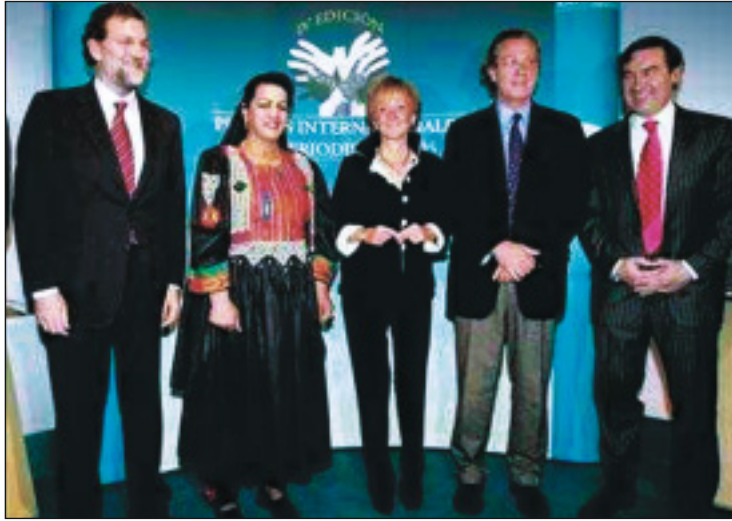
Rajoy y De la Vega, coincidieron en la entrega de los premios de Periodismo 2005

En su primera intervención, la diputada 'popular' comenzó aludiendo a las "5.000 preguntas" por responder que tiene su partido y a las cinco semanas sin control al Gobierno en el Congreso para aludir al también primer secretario del PSC y a la condonación de la deuda de 6,5 millones de euros a este partido por parte de La Caixa. Así, aseguró que "se vetan todas las comparencias cuando se