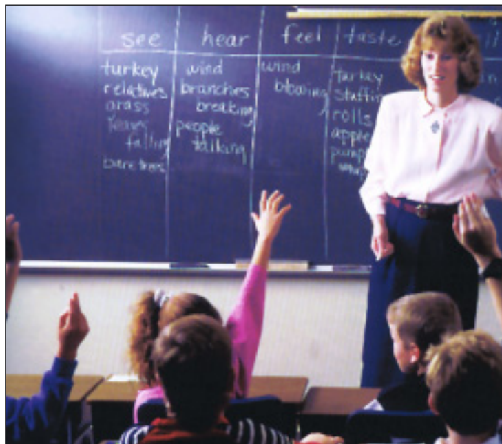
El PP hace en sus enmiendas una gran apuesta por la educación

24. Los movimientos migratorios que se están produciendo en España, fundamentalmente procedentes de la inmigración ilegal, está originando a los municipios importantes gastos ocasionados, básicamente, por la atención que dedican a las necesidades humanitarias de estos inmigrantes. Se propone crear un nuevo fondo destinado a la indemnización de los municipios que se ven especialmente afectados por estos movimientos migratorios, dotado con 18 millones de euros de los cuales 12 millones se destinarán a las ciudades de Ceuta y Melilla. Durante el primer semestre del año 2006 el Gobierno, en colaboración con la FEMP, realizará los