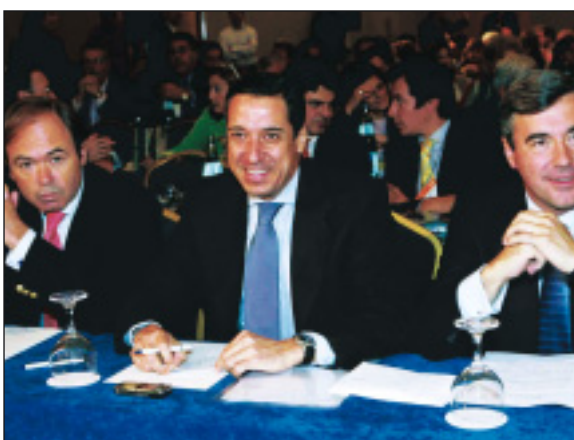
Interparlamentaria popular en Barcelona