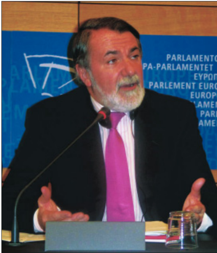
Jaime Mayor Oreja

Previamente, Mayor Oreja había afirmado que “en las actuales circunstancias hubiera sido mejor para todas las partes implicadas y para todos que la Comisión Europea hubie-